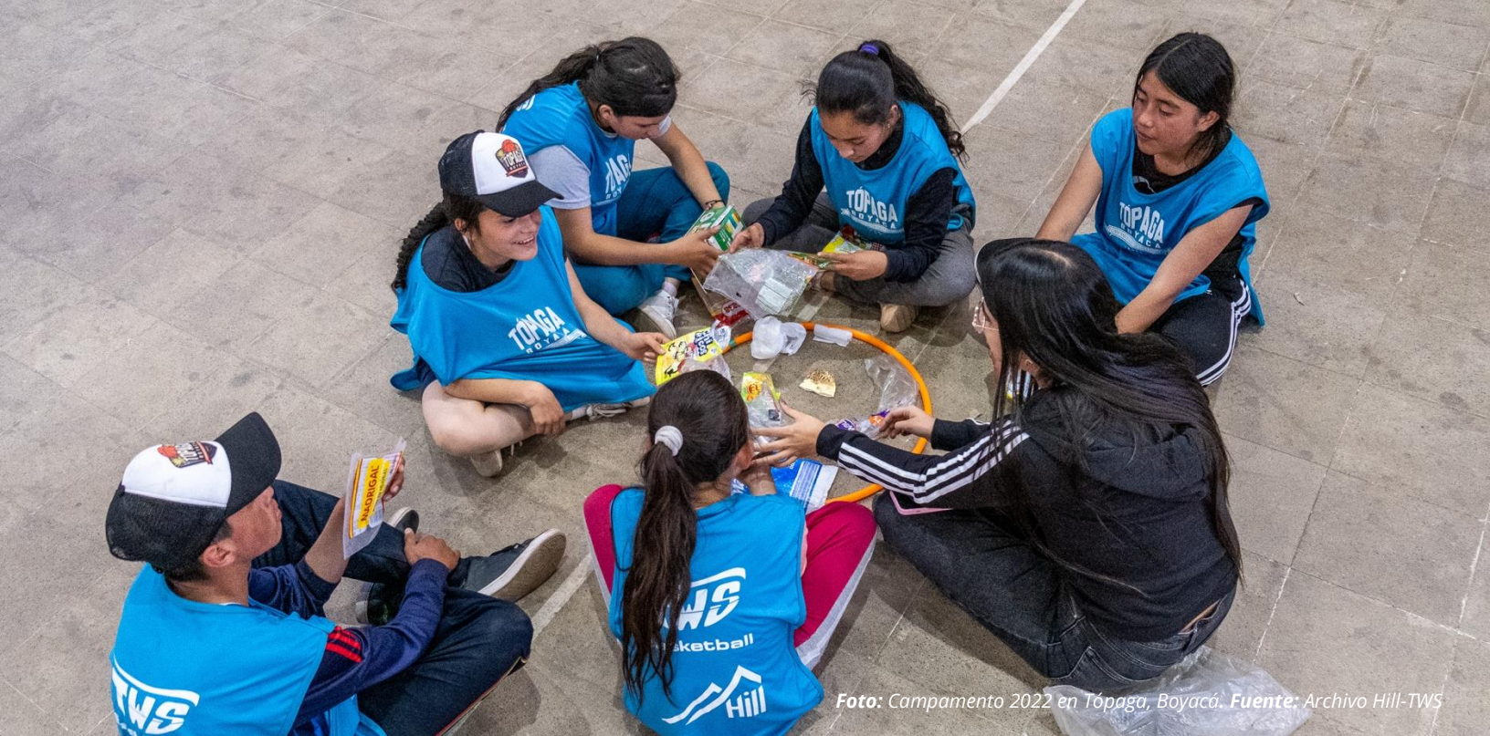
Foto: Campamento 2022 en Tópaga, Boyacá.