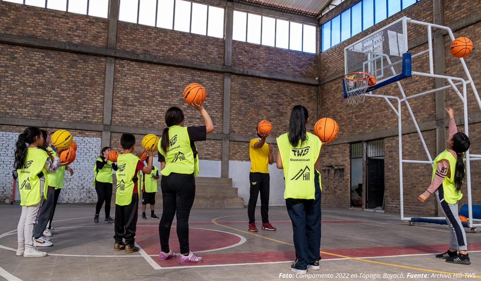
Foto: Campamento 2022 en Tópaga, Boyacá.